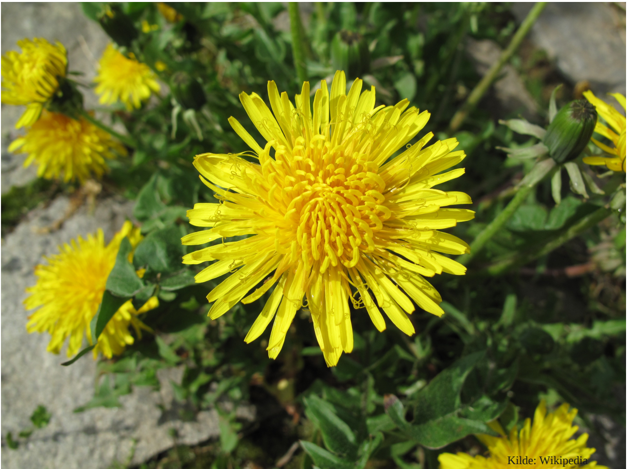
Illustrasjon 1: «Hvem spør løvetannfamilier»

http://www.regjeringen.no/upload/BLD/H%C3%B8ringer/2011/barnets_talsperson_.pdf